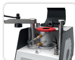
MECAPRESS 4 mould